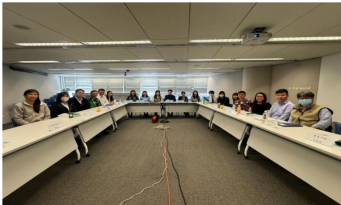
應用學習教師專業網絡 地區小組會議（香港島）於 2024年2月1日舉行